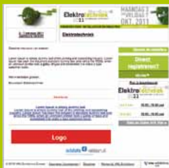
Uw logo in de mail aan bezoekers