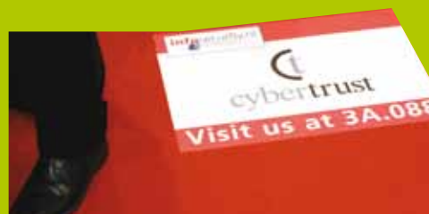
Uw logo op vloerstickers