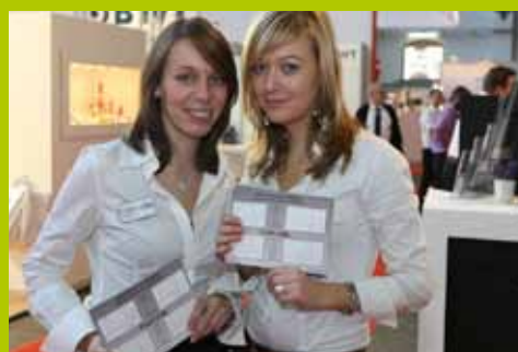
Flyeren op beursvloer