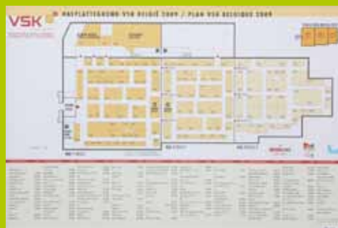
Logo op oriëntatieplattegronden