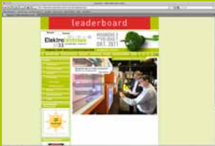
Uw logo op de leaderboard