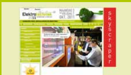
In beeld bij 75.000 bezoekers